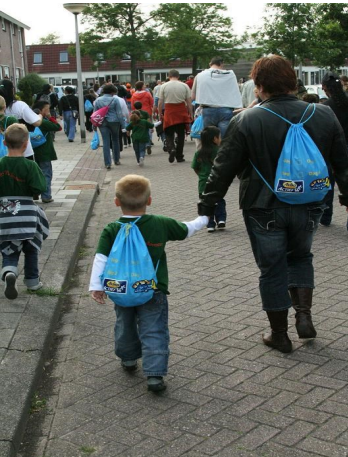
Ook het aantal begeleiders willen wij graag weten.....